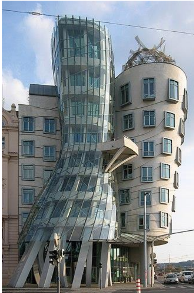
תמונה 3. "הבית הרוקד" גרי ו-מילוניץ, פראג

אפשרות נוספת שקשורה לצורה הכללית היא דפורמציה בצורה, שיוצרת מסר הומוריסטי. כאן, דמיון יצירתי פורה יכול ליצור הומור מעניין ומתוחכם, שמאתגר את דמיון הצופים ומעורר מחשבה. דוגמאות יפות למסר כזה הן תשעה מבנים שנבנו בשנות ה-70 עבור רשת החנויות בסט (best) בארה"ב, ותוכנו על ידי קבוצת Site בראשות ג'יימס ווינס (James Wines). מבנים אלה, תוכנו לבקשת הלקוח בצורה הומוריסטית, כדי ליצור עניין וללכוד את תשומת הלב של עוברי האורח (לרוב נוסעים במכונית), כאשר המבנה כולו משמש מעין פרסומת (בליך ב. 2003, עמ' 90). אבל מעבר למשיכת תשומת הלב, הבדיחות החזותיות במבנים של חברת בסט, מותחות ביקורת סרקסטית על הבנייה הקובייתית הפשטנית של מרכזי הבניות מאותה תקופה, ומנסות לתת להם חלופות הומוריסטיות. בראשון שבהם, בריצימונד ווירג'יניה, פינת החזית "מתקלפת" וחושפת את הקופסה האטומה מאחור. הניגוד שבין החזית המקובלת למראה המתקלף, הרומז שהחזית היא כעין טפט, משעשע. מבנה אחר ברוח זו שהלך רחוק יותר, הוא זה שביוסטון טקסס, מ-1975, שנראה כאילו הוא הרוס חלקית. בדרמטי ביותר, בטוסון אריזונה, 1976, החזית הראשית מורמת במפתיע מעל המדרכה כאילו ענק תלש ועיקם אותה. במודל שתוכנן עבור מיקומים אפשריים ביוסטון ובלוס-אנג'לס ב-1976, ולא נבנה, משטח האספלט מטפס ממגרש החניה על המבנה, ומכסה את כולו בגג שנראה כמו מגרש חניה מעוות שהורם וקומט ברעידת אדמה חזקה. במבנה שניבנה בריצימונד ב-1980, המבנה מבוקע לשניים ובתוכו צומח יער (אתר חברת SITE).