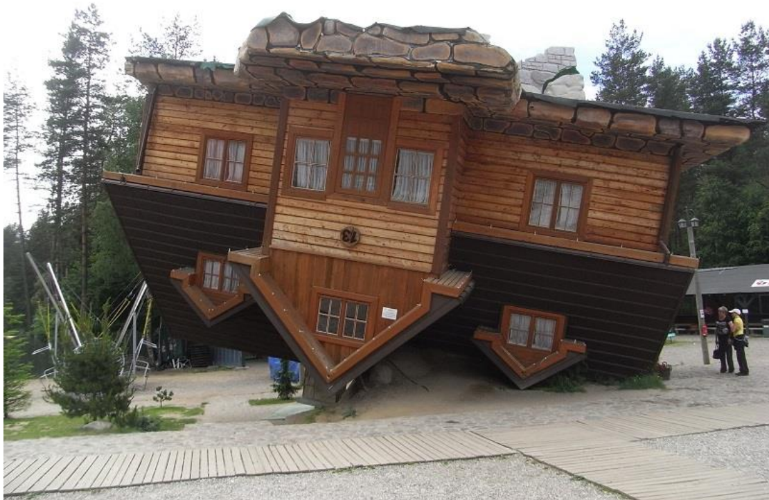
תמונה 8. ה"בית ההפוך", פולין.

אמצעי הומוריסטי אחר של אי-התאמה, הוא שילוב בחזית של חלקים מסגנונות שונים, או עיטורים סמליים המייצגים עולמות שונים. הומור זה הוא לעיתים מכוון, ולעיתים אינו מכוון. בשני המקרים, כדי ליהנות ממנו, הצופה צריך להכיר את ה"כללים" או המוסכמות. לא כל שילוב סגנונות ייצור חוויה קומית, אפילו לצופה הבקיא. כדי שהחוויה תהיה קומית, צריך להיות ניגוד מסוים או חוסר התאמה בין הסגנונות. גם אמצעים פשוטים כמו צבע או חומר יכולים להימצא הומוריסטים, בגלל הסטייה מהצפוי והמקובל. למשל, מבנה "רציני" בסגנון ניאאו-קלאסי, שצבוע כולו בוורוד חזק, יימצא קרוב לוודאי משעשע, לפחות על ידי אנשים שרגילים לראות מבנים כאלה בצבעים שגרתיים יותר. דוגמה מעניינת לצבעוניות משעשעת אפשר למצוא אצל פרידנסרייך הונדרטוואסר. זה עשה שימוש הומוריסטי בצבע, כאשר השתמש בצבעים שונים, לצביעת חלקי חזית שונים, במבנים שתכנן, תוך שהוא הופך את החזית למעין "שמיכת טלאים" אדריכלית.