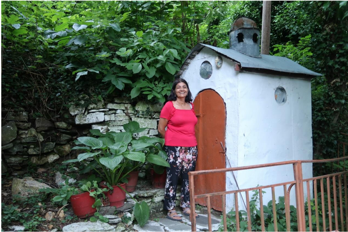
תמונה 5. מבנה שירותים "גמדי" מקריניצה, יוון.

כאמור, בדוגמה אחרונה זו, לא רק הגודל משעשע אלא גם הפרופורציה שבין חלקי המבנה למבנה. פרופורציה כזו יכולה להימצא הומוריסטית גם במבנים שגודלם רגיל. חלקים שונים שיש להם גודל מקובל בגלל הקשר שלהם לשימוש אנושי, כמו חלונות, דלתות, מרפסות, מדרגות ומעקות, יימצאו הומוריסטים כאשר יחרגו מגודלם במידה ניכרת. שימוש הומוריסטי קרוב לזה, הוא ציטוט חלקי מבנים מוכרים, בקומפוזיציה חדשה שיוצרת מכלול משעשע. במקרה כזה הציטוט של משהו מוכר מחוץ להקשרו, מוסיף הומור. דוגמה משדה המוסיקה לשימוש הומוריסטי כזה אפשר למצוא בסוויטות ההומוריסטיות לפסנתר של סאטי, מהשנים 1917-1913 (Hare B. J. 2005). בדוגמה המצורפת: כנסייה כפרית ברומניה, מערך הצריחים המוגזם על גג המבנה הקטן, וגודלם המוחלט של הצריחים, ביחס לחלונות המבנה, יוצר ניגוד קומי של חוסר התאמה בולט בין החלק התחתון של המבנה לחלקו העליון, ובין צורת הצריחים, השאולים ממבנים אחרים, לשימוש. ברור שלא ניתן להיכנס לצריחים, וכל שהם עושים הוא הכנסת מעט אור, אבל צורתם מרמזת על משהו אחר.