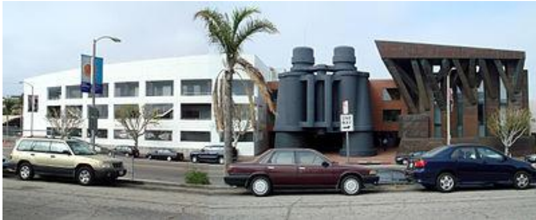
תמונה 2. "בית המשקפת". ארכיטקט פרנק גרי.

דוגמה למבנה מחקה מתוחכם יותר ניתן לראות במבנה דמוי המשקפת שתכנן פרנק גרי, תוך שימוש במודל שעיצבו האמנים קלאס אולדנבורג וקוז'יה ואן ברוגן, ושנבנה בין 1986 ל-1991 בלוס אנג'לס, עבור חברת פרסום.