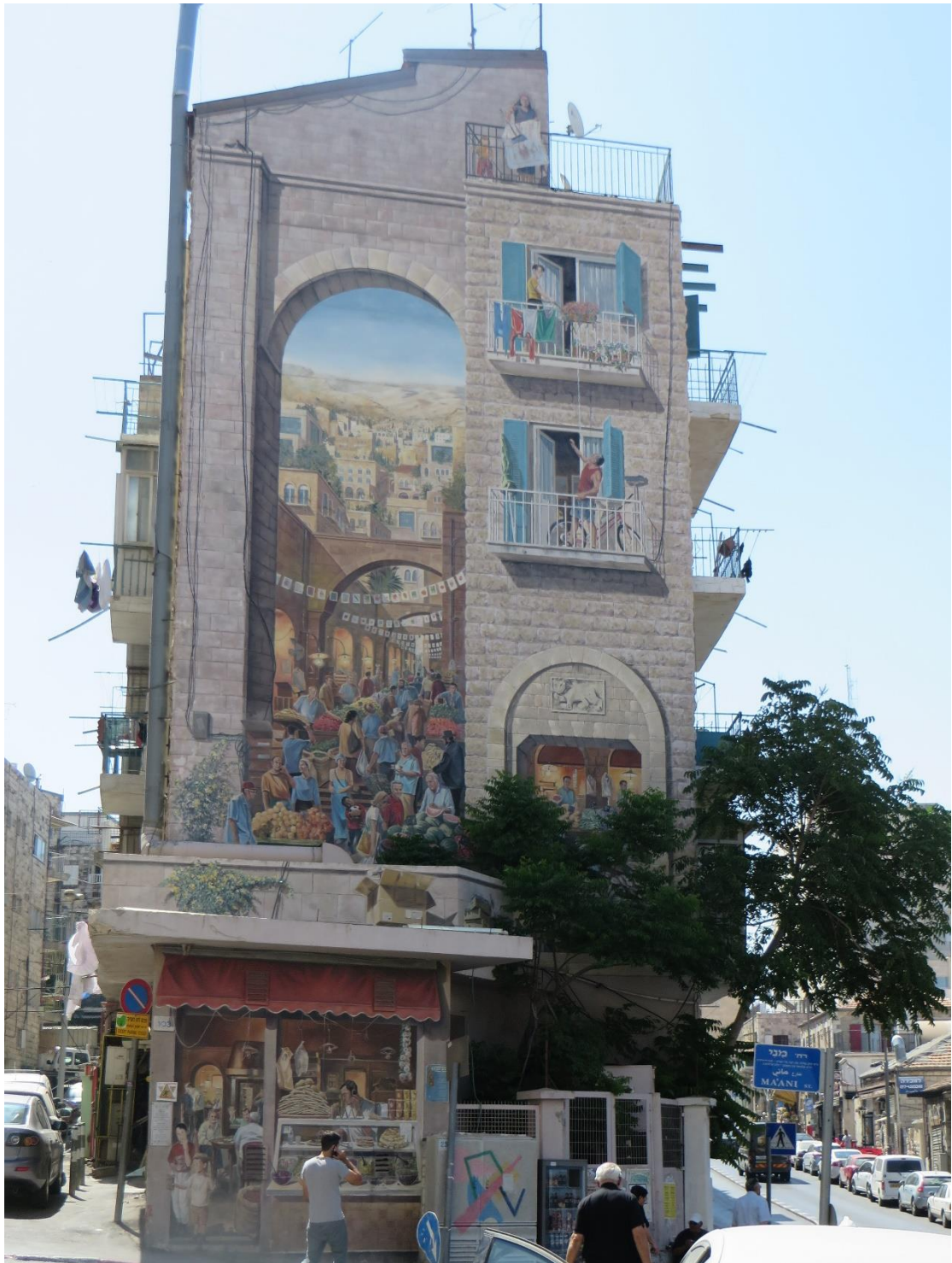
תמונה 19. ציור קיר שמשנה את מראה המבנה ויוצר "מבנה" חדש. ירושלים.

דוגמה אחרת שמדגימה הומור בקישוט מתוכנן, אפשר לראות בתמונה הבאה, מגואטפה (Guatepe) שבקולומביה. בגואטפה, חוק הבניה המקומי מחייב את כלל המבנים בעיר להוסיף תבליט צבוע בגובה של כמטר בתחתית המבנה, לכל אורכו. הכרח זה מספק שפע אפשרויות למבעים הומוריסטים מגוונים, שמשתלבים במבנה. ההנחיה יוצרת בכל מבנה חלק הכרחי של ביטוי אישי. חלקו מנוצל לפרסום, חלקו להבעת עמדות פוליטיות, מבעים יצירתיים, סתם עיטור, וכן הלאה. כמות ההומור רבה, ועובר האורח יכול לחפש את העיטורים המשעשעים המוצלחים. כאן, התבליט