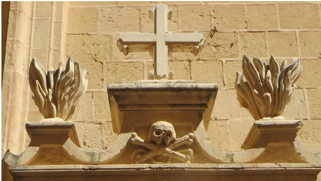
תמונה 14. פרט הומוריסטי? כרכוב מעל כניסה לכנסייה. מלטה.

בפרט הבא, שממוקם מעל דלת הכניסה לכנסייה במלטה, עיטור הגולגולת עם העצמות המוצלבות יוצר הומור מקברי. חלק מההומור, שלא ברור עד כמה הוא מכוון, הוא השימוש בסמל כזה מעל כניסה לכנסייה. חלק אחר נובע מהעיטור עצמו, בו הגולגולת מחזיקה את העצמות בפיה, בתנוחה משונה ומשעשעת. במקרה זה יתכן וההומור נוצר בגלל פער תרבותי, כאשר צופה שאינו מבין את המסר של העיטור, מוצא אותו משונה מאוד בהקשר של מבנה דת.