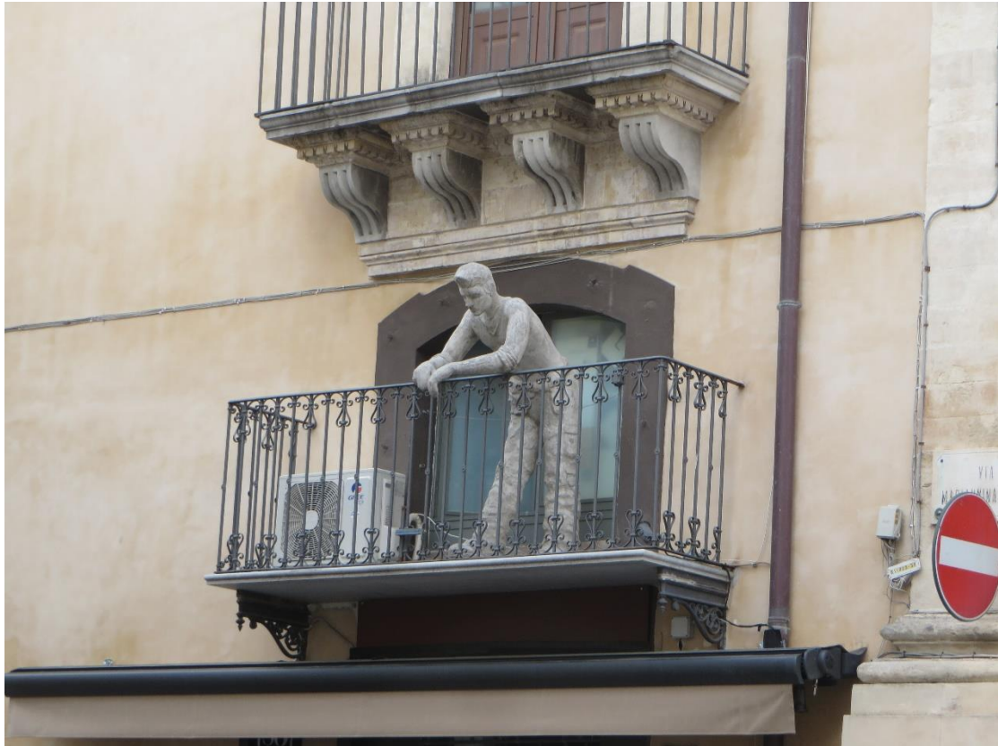
תמונה 18. פסל אדם בגודל טבעי שמציץ ממרפסת בסירקוזה, סיציליה.

שימוש במשטחי הקיר כמצע למסרים הומוריסטים אפשרי גם כן. שימוש זה יכול להופיע באופן נדיר כיוזמת המתכנן המקורי. באופן הנפוץ יותר, הוא יוזמה של אנשים אחרים. הצורה השכיחה למסרים הומוריסטים על משטחי קירות היא ה"גרפיטי". גרפיטי יכול לכלול מסרים כתובים, שיכולים להימצא הומוריסטים, וציורים שיכולים להימצא הומוריסטים, אבל אלה אינם "הומור ארכיטקטוני". הגרפיטי יכול להיכלל בהומור הארכיטקטוני רק כאשר הוא משתלב במבנה, ויוצר יחד אתו מכלול הומוריסטי. בתמונה המצורפת, מבנה מרחוב אגריפס בירושלים. דופן שלמה במבנה כוסתה בציור קיר, שיש בו ממדים הומוריסטים שונים. הציור משלים את ארכיטקטורת המבנה באופן שיוצר מכלול ארכיטקטוני חדש וסוריאליסטי. בין החלקים המשעשעים ניתן לראות את התוספת המצוירת למרפסת הגג, את הסצנה ההומוריסטית של ההתרחשות בין המרפסות המצוירות מימין, ואת הרחוב שנשקף לפתע בתוך המבנה. הגורמים ההומוריסטים במקומות שצוינו שונים זה מזה, ומדגימים חלק ממגוון האמצעים ההומוריסטים הרחב שיש באפשרות הגרפיטי לעשות בהם שימוש. התוספת למרפסת יוצרת אלמנט "מרפסת", שחלקו אמיתי וחלקו מדומיין. כאשר קולטים את השילוב המוזר הזה הדבר נתפס כמצחיק. הסצנה המתרחשת בין שתי המרפסות המצוירות, מסתכלת במבט משועשע על יחסי השכנים הטיפוסיים ברחוב הירושלמי. הרחוב הסוריאליסטי המדומה בתוך המבנה, משעשע בעיקר בגלל ההפתעה שהוא יוצר, עם משטח הרחוב הגבוה, הנוף המדומיין, והשמיים המצוירים שאינם ממשיכים את השמים האמיתיים. יתכן שגם הניגוד התפיסתי שבין קיר מוצק, למרחב עמוק, תורם לפן ההומוריסטי בחלק זה.