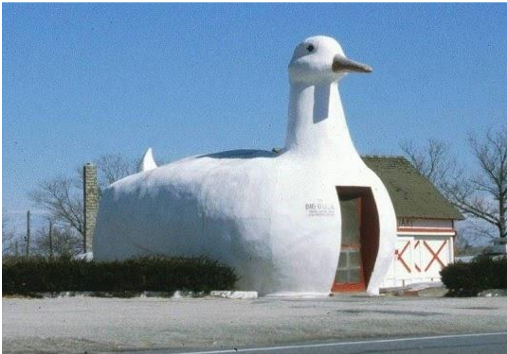
תמונה 1. "הברווז הגדול", לונג איילנד, 1931.

כאשר מדובר במבנה כולו, צורת המבנה, גודלו, והפרופורציות וההתאמה בין חלקיו, יכולים כולם ליצור הומור. צורת המבנה היא האמצעי הבולט ביותר לעין. לרוב, יצירת צורה הומוריסטית היא תוצאת מאמץ מכוון, אבל, לפעמים כוונה ליצור צורה "חדשנית" או "מהפכנית", מתבררת לפי דעת הקהל כהומוריסטית, בגלל האסוציאציות שהיא מעוררת. דוגמה יפה היא "מגדל המלפפון" בלונדון (The Gherkin), שתוכנן על ידי נורמן פוסטר. דוגמאות אחרות הן "מגדל הטיל" בחיפה, והאופרה של סידני. אם נחזור להומור המכוון, צורה חריגה או משונה, שעיצובה פשטני או גס, תיתפס כהומור נחות יחסית, בעיקר כאשר מדובר ב"אדריכלות מחקה". כך, מבנה בצורת ברוז או בצורת מנת המבורגר, יכולים לרמוז על תפקוד המבנה, ולהעלות חיוך, אבל רמת ההומור בהם נמוכה. לעומת מסר ישיר זה, צורה מחקה שמעבירה מסר מתוחכם יותר, תיתפס כהומור מרמה גבוהה מעט יותר, אם כי גם היא אינה הומור מתוחכם. דוגמה מוקדמת למבנים הומוריסטים פשוטים, שאמורים למשוך תשומת לב למטרות רווח, אפשר למצוא ב"ברווז הגדול", מבנה ששירת חנות לממכר בשר בלונג איילנד, בראשית שנות השלושים של המאה העשרים.