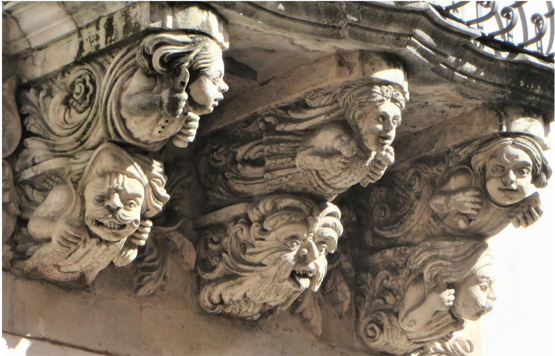
תמונה 12. תומכות של מרפסת שיוצרות סצנה הומוריסטית. נוטו, סיציליה.

דוגמה אחרת היא פסלון יונה בגודל טבעי מסיציליה. הפרט משעשע מפני שלוקח זמן להבין שמדובר ביונת אבן ולא בדבר האמיתי. חלק מהשעשוע נובע מהבחירה המשונה ביונה בודדת כקישוט אדריכלי בבית מגורים. העציץ שעומד על המעמד הסמוך מוסיף לבלבול ומחזק את ההפתעה.