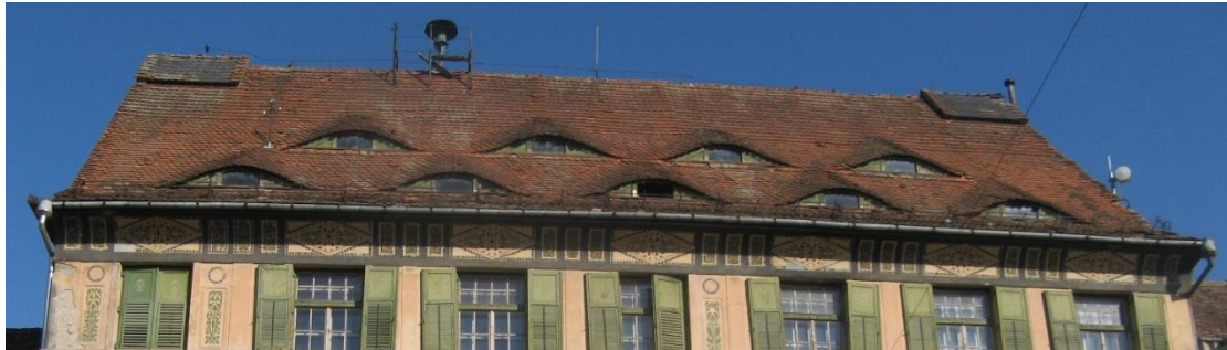
תמונה 11. גג מבנה שנועץ עיניים. רומניה.

לא רק "פנים" שמופיעים על החזית, עשויים להיתפס באופן הומוריסטי. לעיתים אפילו חלקי פנים, דוגמת חלון שצורתו עין, או דלת שצורתה פה, יעוררו צחוק. בדוגמה המצורפת מבית מגורים ברומניה, הגג נועץ בעובר האורח עיניים, ויוצר מבנה משעשע.