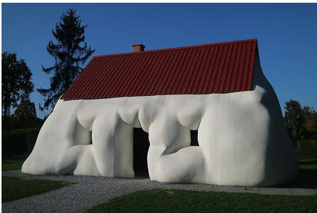
תמונה 10. "הבית השמן", ארווין וורם. וינה.

כאשר חלקים במבנה, בעיקר חלונות דלתות ומרפסות, הופכים את מראה החזית לדמוי פני אדם, ובעיקר דמוי פנים מעוותים במקצת, או בעלי העוויה, הדבר מעורר צחוק וגיחוך. זאת, בדומה לפני חיות שנדמים כבני אדם שמעוררים צחוק, בגלל עצם הדמיון הנתפס כמשונה (ברגסון ה. 1981 עמ' 8). הומור זה נובע מהנטייה האנושית המובנית לתפוס מערכי צורות שונים כמייצגי פנים אנושיים (כמו שאנו "רואים" למשל את הפרצוף בירח), ומכך שאלמנט נחות מהאדם, נתפס לפתע כאנושי. בדוגמה המצורפת, "הבית השמן", של האמן האוסטרי ארווין וורם מ-2003, לא רק הדלת והחלונות מדמים פני אדם, אלא הקירות עצמם, "שמנים", בצורה משעשעת. בגלל עיצוב הקירות הפלסטי, המבנה עצמו נעשה אנושי ומגוחך. הגג הקטן שהקירות בולטים מתחתיו מעלה בדמיון שמן שחובש כובע קטן למידותיו, דבר שמגביר את המבע ההומוריסטי.