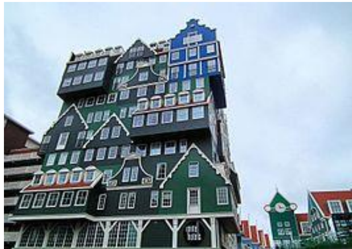
תמונה 9. מלון אינטל, אמסטרדם.

כאשר חלקים במבנה, בעיקר חלונות דלתות ומרפסות, הופכים את מראה החזית לדמוי פני אדם, ובעיקר דמוי פנים מעוותים במקצת, או בעלי העוויה, הדבר מעורר צחוק וגיחוך. זאת, בדומה לפני חיות שנדמים כבני אדם שמעוררים צחוק, בגלל עצם הדמיון הנתפס כמשונה (ברגסון ה. 1981 עמ' 8). הומור זה נובע מהנטייה האנושית המובנית לתפוס מערכי צורות שונים כמייצגי פנים אנושיים (כמו שאנו "רואים" למשל את הפרצוף בירח), ומכך שאלמנט נחות מהאדם, נתפס לפתע כאנושי. בדוגמה המצורפת, "הבית השמן", של האמן האוסטרי ארווין וורם מ-2003, לא רק הדלת והחלונות מדמים פני אדם, אלא הקירות עצמם, "שמנים", בצורה משעשעת. בגלל עיצוב הקירות הפלסטי, המבנה עצמו נעשה אנושי ומגוחך. הגג הקטן שהקירות בולטים מתחתיו מעלה בדמיון שמן שחובש כובע קטן למידותיו, דבר שמגביר את המבע ההומוריסטי.