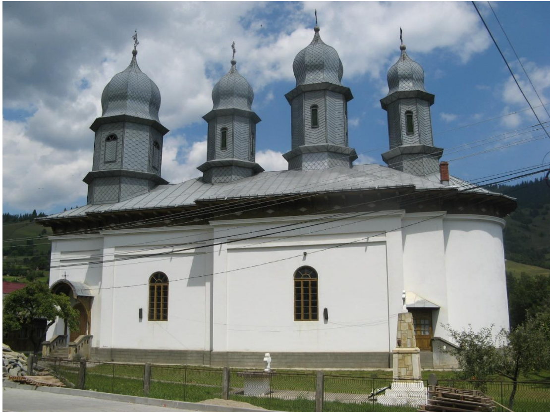
תמונה 6. כנסייה כפרית ברומניה. החלק העליון אינו מתאים לחלק התחתון.

שני סוגים נוספים של חוסר התאמה, עם קשר חזק ביניהם הם: חוסר התאמה קונסטרוקטיבית, וחוסר התאמה של השקעה לתוצאה (יעילות). נראה שלאדם יש תפיסה מולדת טובה למדי של "מבנה נכון" ביחס לגופים טבעיים. המבנה הנכון קשור ליעילות הצורה מבחינה תפקודית, ולהגייונה הקונסטרוקטיבי (שביד ג. 2016, עמ' 129-130). את התפיסה הזו המוח מעתיק גם לעצמים מעשה ידי אדם, במבנים, אי התאמה, בעיקר ביחס ליעילות, נתפסת לרוב כמגוחכת. כך, השקעה ניכרת גדולה במבנה, שתוצאתה קטנה. למשל, מערך מדרגות רחבות ומפוארות שמסתיים בחדרון המשמש מחסן, או עמוד גדול ורחב שנושא מרפסת זעירה. הומור כזה, יכול להיות מכוון או מקרי. הומור קונסטרוקטיבי מתוחכם יכול להתייחס לאלמנטים מקובלים. למשל, חזית עם עמודים, כאשר הכותרות שעל העמודים הן כדורים, תימצא כנראה משעשעת, בעיקר עבור מי שמבין משהו בארכיטקטורה, ובהובלת עומסים במבנה.