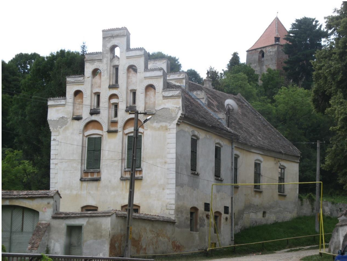
תמונה-4. מבנה מגורים עם חזית תפאורה חלקית. רומניה.

במקרה זה נובע גם מכך שחזית של מבנה מציגה לכאורה מערך מבנים מוקטנים, שמהווים בו בזמן חלק ממבנה אחר.