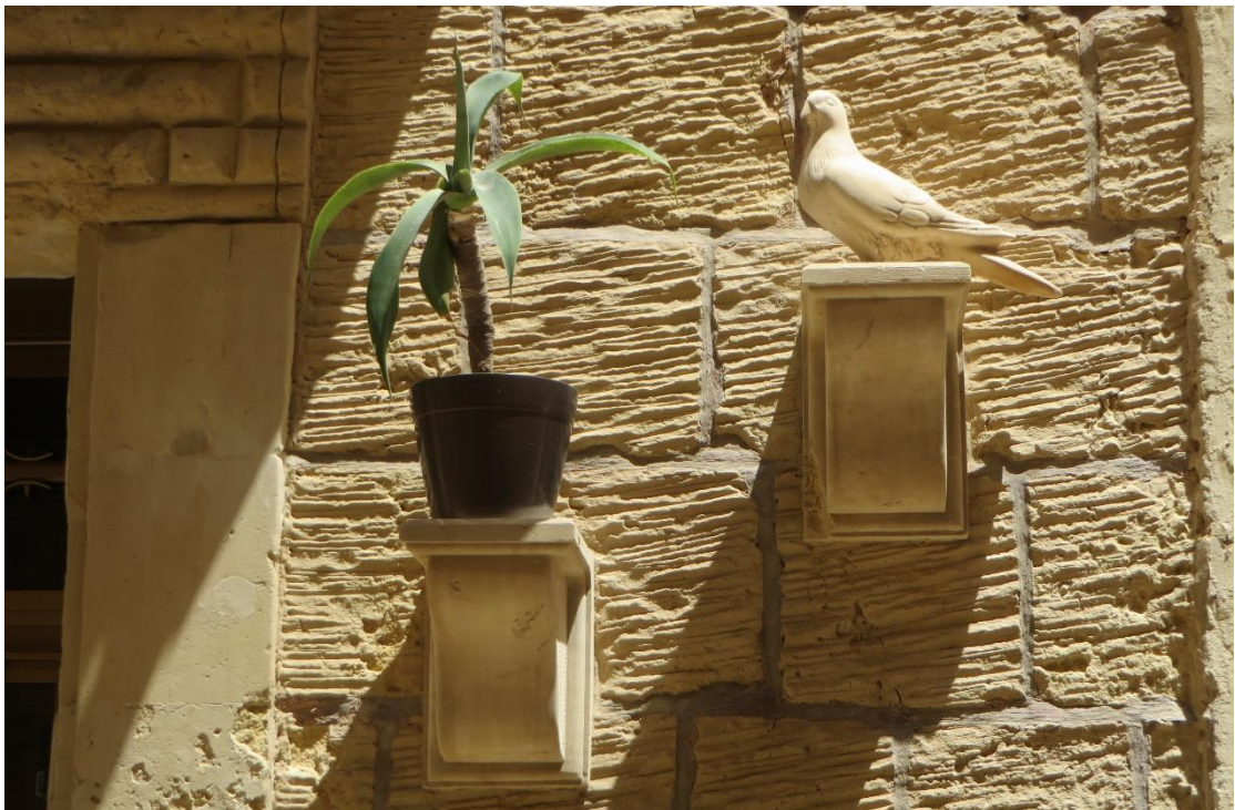
תמונה 13. פרט הומוריסטי. בית מגורים בסיציליה.

דוגמה אחרת היא פסלון יונה בגודל טבעי מסיציליה. הפרט משעשע מפני שלוקח זמן להבין שמדובר ביונת אבן ולא בדבר האמיתי. חלק מהשעשוע נובע מהבחירה המשונה ביונה בודדת כקישוט אדריכלי בבית מגורים. העציץ שעומד על המעמד הסמוך מוסיף לבלבול ומחזק את ההפתעה.