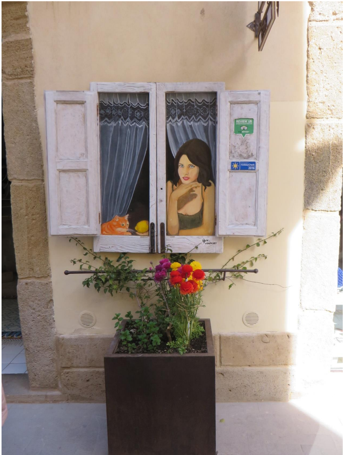
תמונה 16. חלון מדומה. קלטריג'ונה, סיציליה.

בדוגמה הבאה, יצירת אמנות ששולבה במבנה קיים: מוזיאון מומוק בווינה. ההומור נוצר במקרה זה מהשילוב האבסורדי, המציג מבנה שכביכול נחת הפוך מהשמים על גג של מבנה אחר. היות ומבנים אינם נוהגים לעופף, הדבר יוצר מבע סוריאליסטי-הומוריסטי ברור, שנוגע לסטיה מהכללים לפיהם מתנהל העולם. חלק אחר מההומור, נוגע אולי למראה המוזיאון, שחזותו האטומה מזכירה בונקר יותר ממוזיאון. בהקשר זה, התקפה של "בית", מתייחסת בביקורת למה שמסדרת חזית המוזיאון.