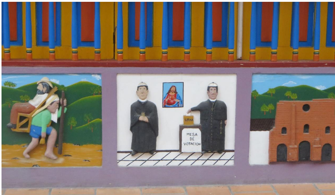
תמונה 20. תבליט קריקטורי. גואטפה, קולומביה.

הצבוע עושה צחוק מחמדנות וצביעות הכמורה. זאת בדומה לבדיחות מילוליות רבות, ולקריקטורות, ששמות גורמים שונים לצחוק.