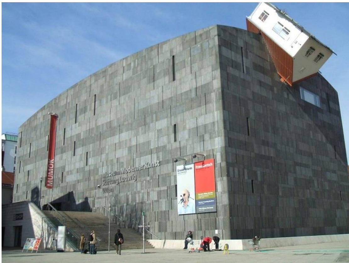
תמונה 17. הבית המתקיף, ארווין וורס. וינה.

בנוסף לתוספות או חלקים אבסורדיים במבנה שהוספו על ידי המתכנן, או על ידי אמן, גם תוספות שמוסיפים לעיתים דיירים, יכולות ליצור מכלול הומוריסטי. לדוגמה, פסל אדם בגודל טבעי שמוצב במרפסת ומשקיף אל הרחוב, כמו במקרה זה בסירקוזה סיציליה. כפי שניתן לראות, הפסל עצמו אינו הומוריסטי, אבל הצבתו כחלק מהמכלול הארכיטקטוני, יוצרת מצב הומוריסטי, כאשר מבינים שאין מדובר באדם אמיתי.