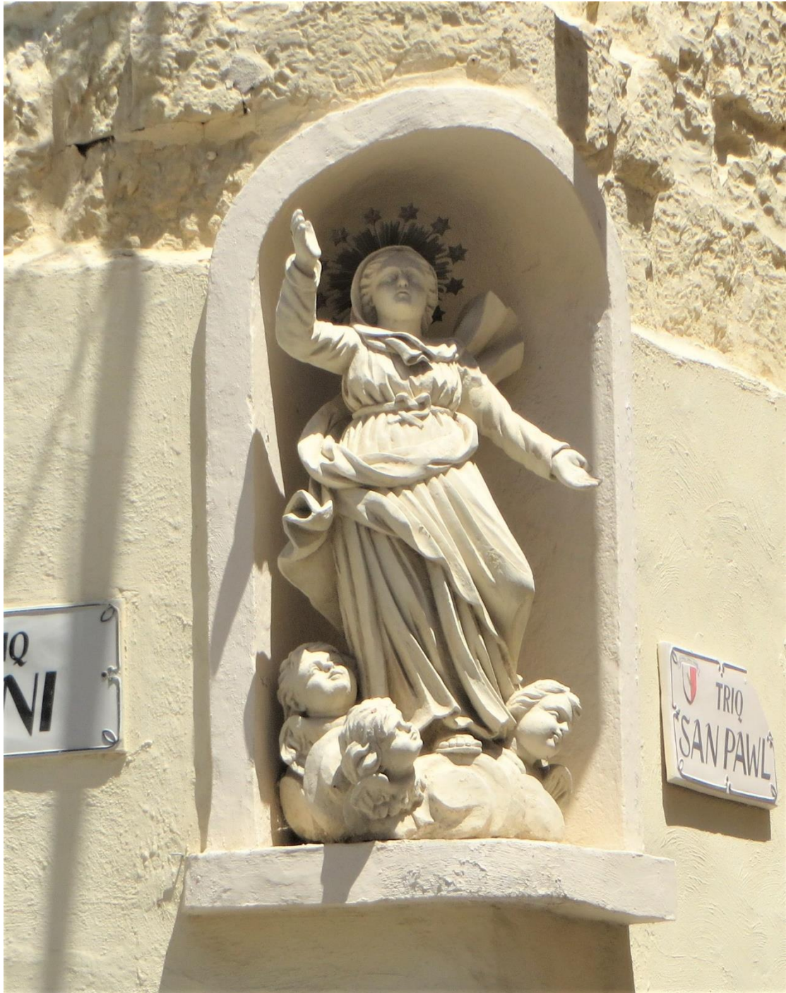
תמונה 15. מדונה "רוקדת", ולטה, מלטה.

לעומת חלקים אינטגרליים לחזית, ייתכנו גם חלקים שהוספו לחזית לצורך יצירת אמירה הומוריסטית. לדוגמא, חלון מדומה שמציג כלפי חוץ סצנה שנשקפת כביכול מתוך המבנה אל הרחוב. בתמונה המצורפת, חלון מדומה מקלטריגיונה סיציליה. ההבנה שמאחורי תריסי העץ ומסגרת החלון האמיתיים, המראה הנשקף מצויר, יוצרת הפתעה קומית. גם יצורים משונים שמציצים מעל הגג, כשהם מאיימים לבלוע את המבנה או חלקו, יכולים להימצא הומוריסטים, וכך גם מרפסת מפוארת עם שולחן קפה ושני כסאות שאין דלת שמחברת אותה לחלל שבפנים.